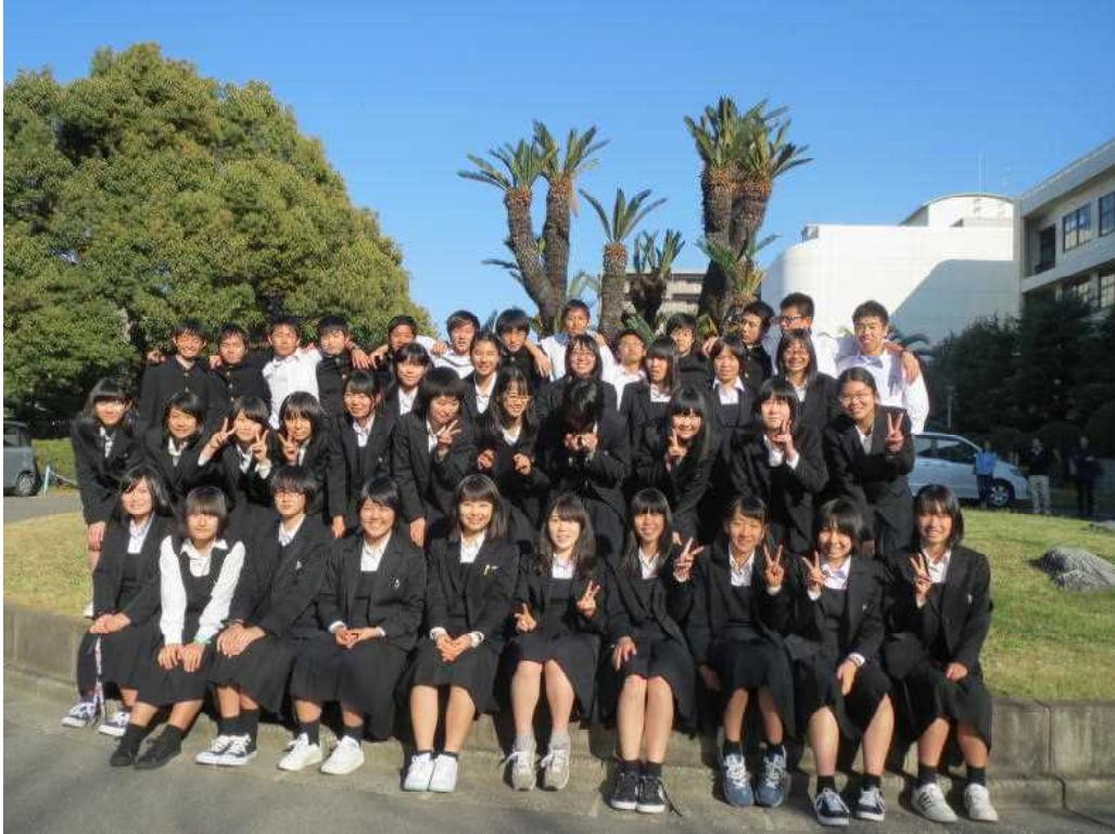
平成27年度 1年国際文科コース

短い期間でしたが、たくさんの思い出ができました。オーストラリアのファミリー、そして日本の家族にも感謝の気持ちでいっぱいです。