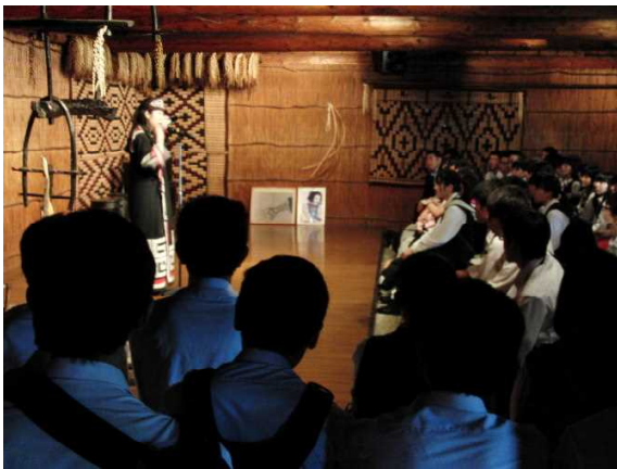
アイヌ民族の歴史や文化も学びました