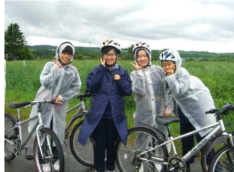
ラフティングやサイクリング等の体験教室