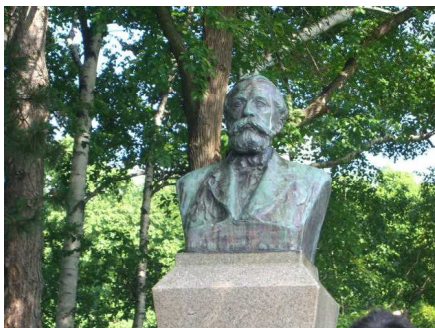
北海道大学キャンパス見学 (志望大学になった生徒もいたはず)